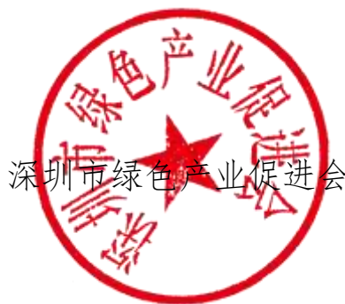
深圳市绿色产业促进会