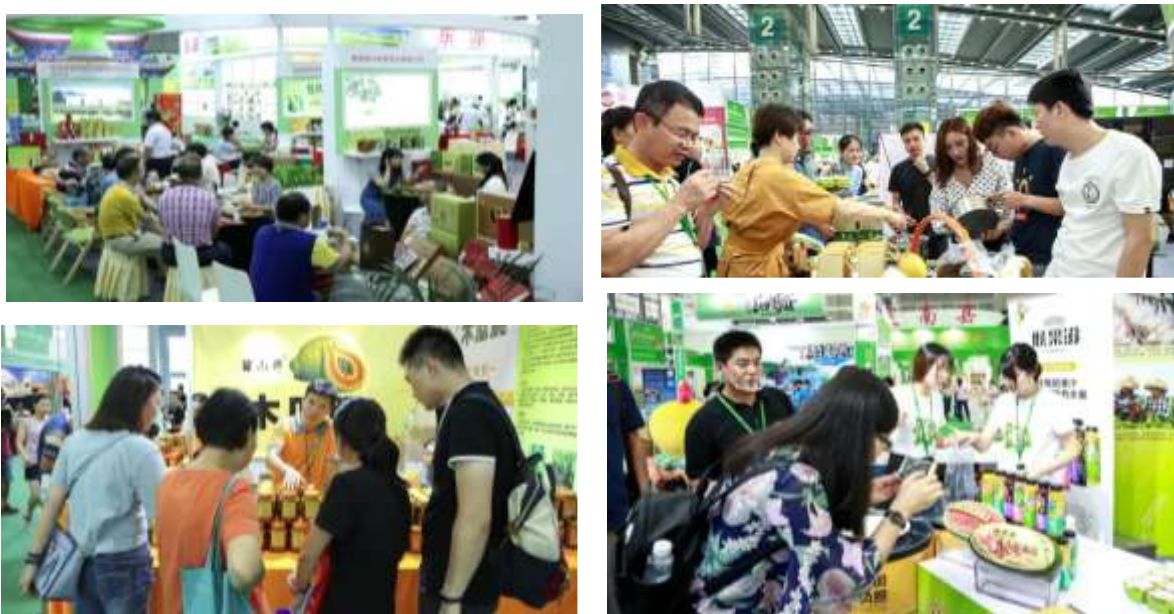
图 9-12 观众现场品尝展品、洽谈业务合作