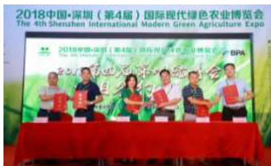
图 16 项目签约