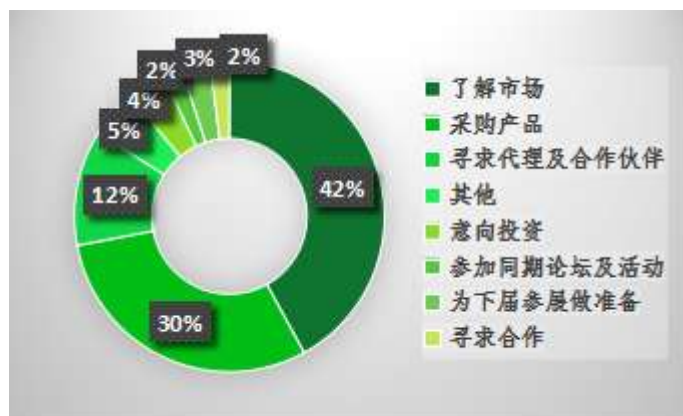
图 7 参观目的

观众参观目的以了解市场及采购产品为主，二者所占比例高达 72%；而专业观众意向在现场找到农业行业代理商及合作商也近 10%。