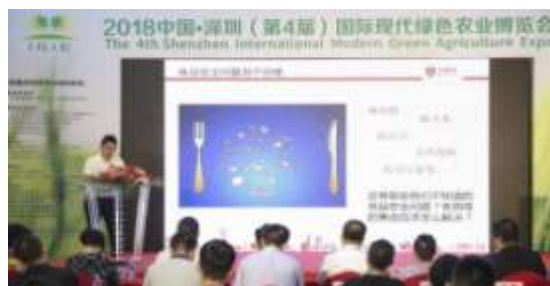
图 15 嘉宾现场演讲