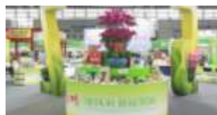
图2 深圳现代农业成果展展品