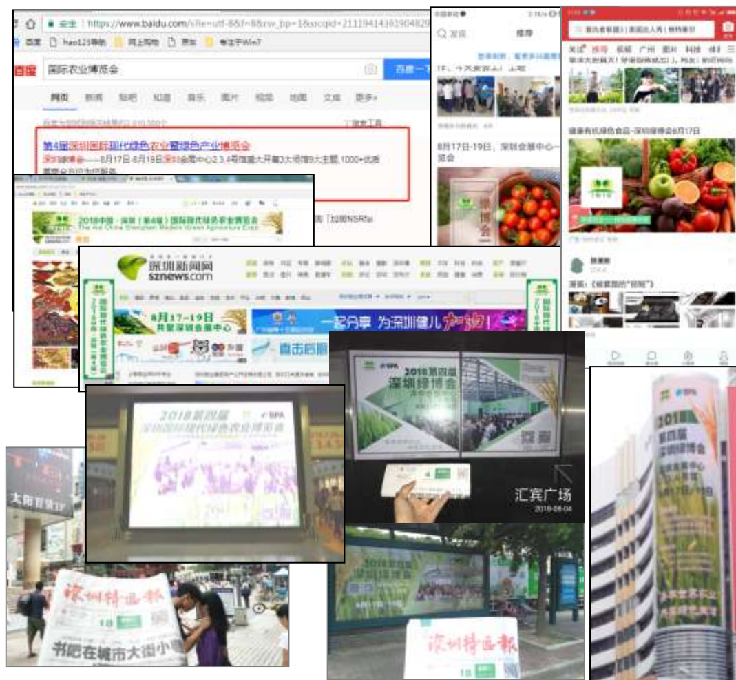
图 13 部分宣传渠道展现