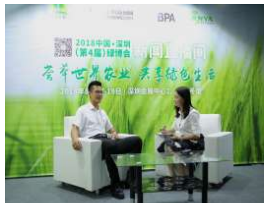
图 19 现场采访