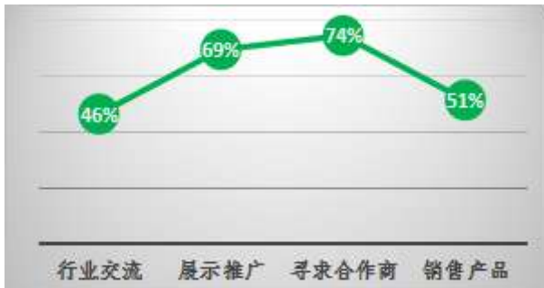
图4 参展目的(本题为多选,比例超100%)

本届展商客户群体中,寻求投资商、采购商为参展目的客户占比74%;而以农业行业的信息交流、企业和产品的形象展示推广作为参展目的的展商也超过半数,符合深圳消费市场大的特点,尤其是本届展会中,很多来自深圳对口扶贫地区及全国其他地的原生态农产品在展会上展示,吸引了入场的买家及消费者的目光。