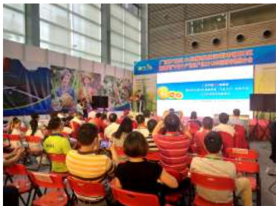
图 18 罗城推介会