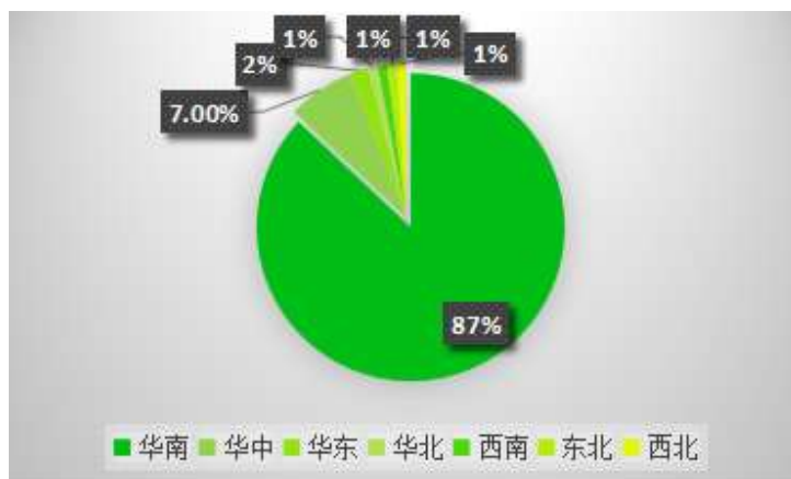
图 6 观众地区分布

本届展会观众以广东省内为主,并有江西、广西、湖南、湖北、黑龙江等多个省市观众,占到展会入场观众比例的 90%,以及部分国际专业观众入场。据统计,入场专业观众超过 3 万人次。