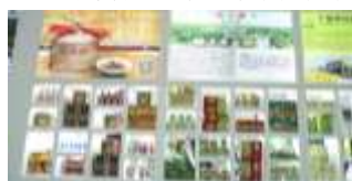
图3 东源县展商展品