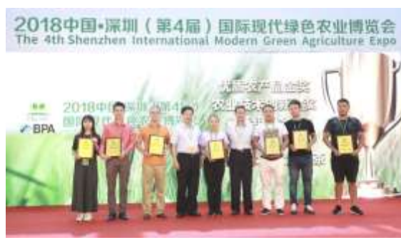
图 17 农业技术创新金奖颁奖