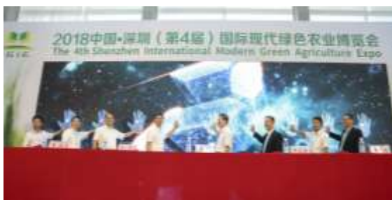
图 14 开幕式